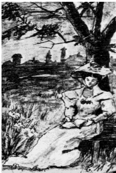
Imagen 3: Dibujo realizado por Cornelia, Álbum , s/f.