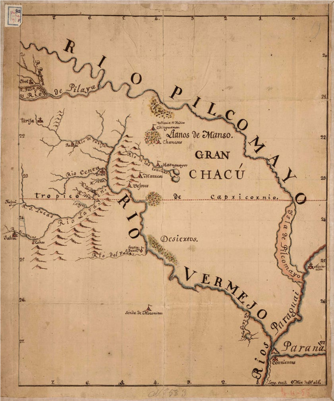
Mapa n° 2