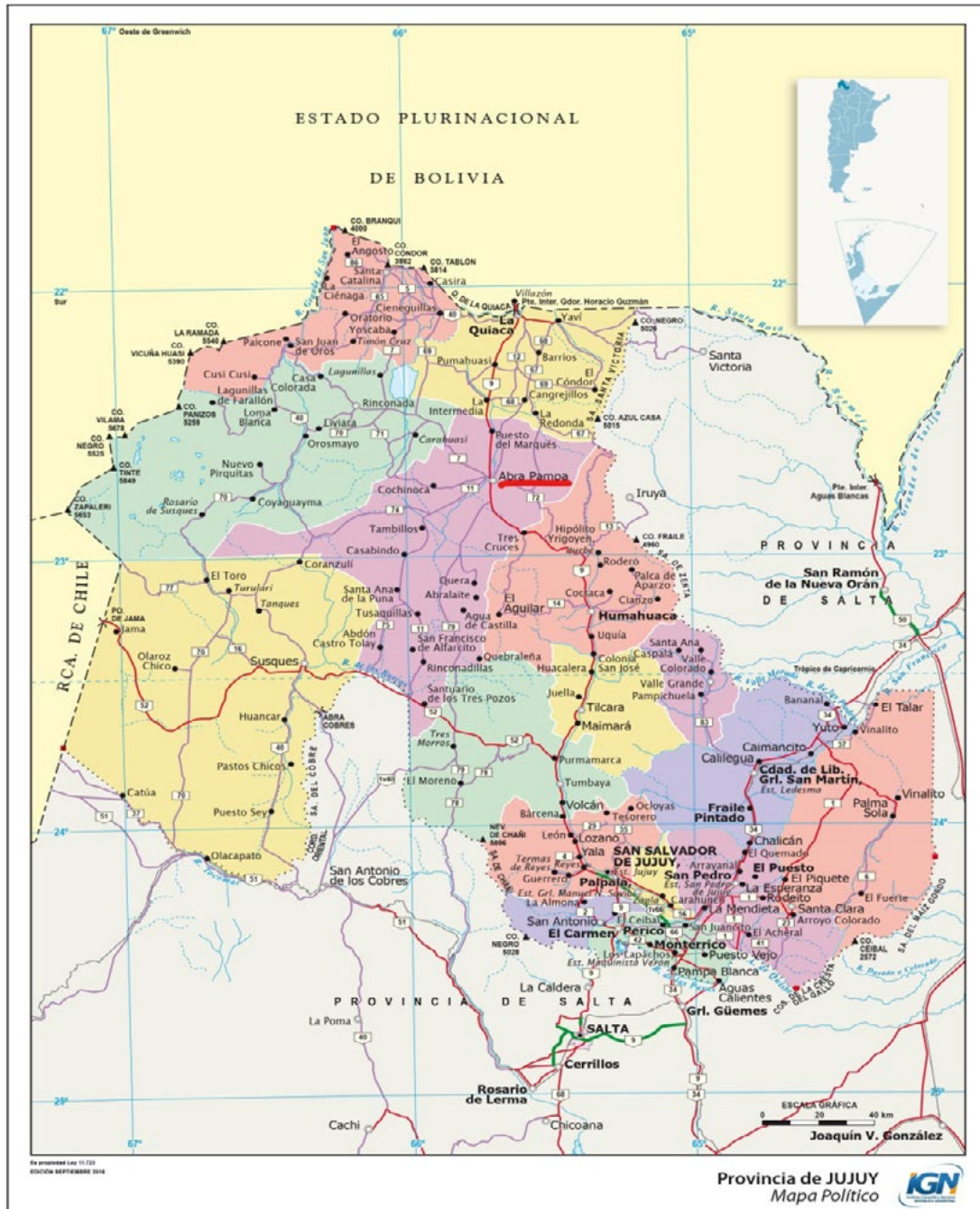
Mapa N° 1: Mapa político de la Provincia de Jujuy