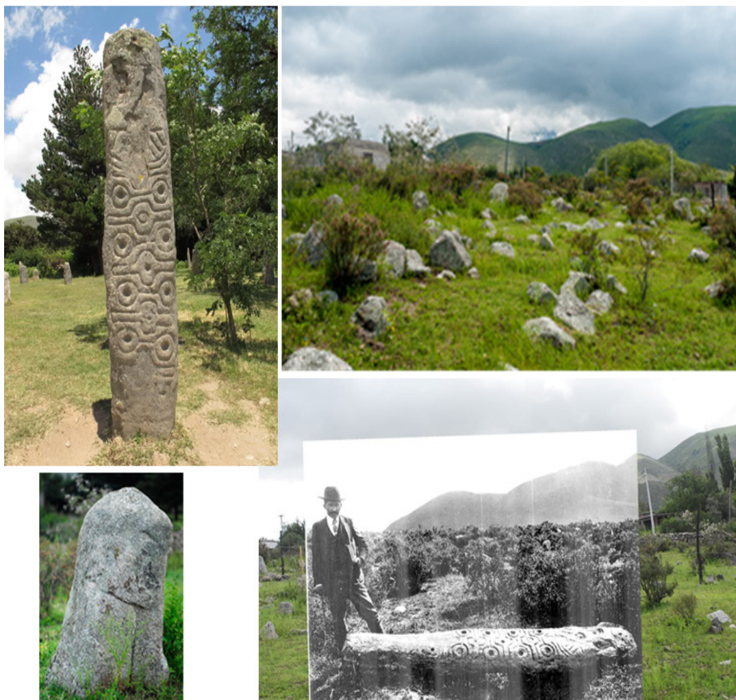
Figura N° 3. El “Gran Menhir” (o “menhir Ambrosetti”) en la Loma del Algarrobo. Arriba a la izquierda la Piedra Larga en el actual Museo a Cielo Abierto en El Mollar; abajo a la izquierda, una piedra-huanca en el contexto arquitectónico ancestral. Arriba a la derecha, el entorno del emplazamiento original, y abajo a la derecha, una superposición fotográfica con una de las imágenes de comienzos del siglo XX, de Carlos Bruch. Las fotos son de mi autoría.

Del otro lado del río El Mollar, al Oeste, en la localidad de Casas Viejas, se localizaban más de quince monolitos (N° 3 de la Figura N° 2), varios de ellos, grabados. Algunas de estas piedras - huanca s se hallaban ubicadas en proximidad de un importante montículo de forma oval (30 x 18m) y unos 3m de altura.