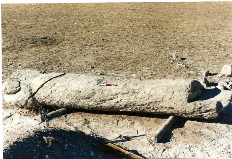
Figura N° 4. Monolito hallado al excavar una fosa en el cementerio del Ojo de Agua.

Al presente no contamos con elementos suficientes para evaluar la contemporaneidad en la instalación de estas Piedras Largas en los distintos sectores del Valle de Tafí. Sin embargo, dada su perdurabilidad y visibilidad estos monolitos fueron formando parte y configurando paisajes con un profundo sentido de ancestralidad, denotando una concepción del territorio que se hunde en los tiempos y se va refundando permanentemente. Las nuevas arquitecturas y los nuevos espacios construidos de cada momento se integran en esos paisajes previos, reconfigurándose como territorio. Tanto en Casas Viejas y El Mollar, como más al Norte, en el C° Pelao o los conos del río La Puerta o el del Blanquito las investigaciones van dando cuenta de que la gente fue habitando espacios ya habitados, construyendo sus territorios a partir de lo pre-existente 97 .