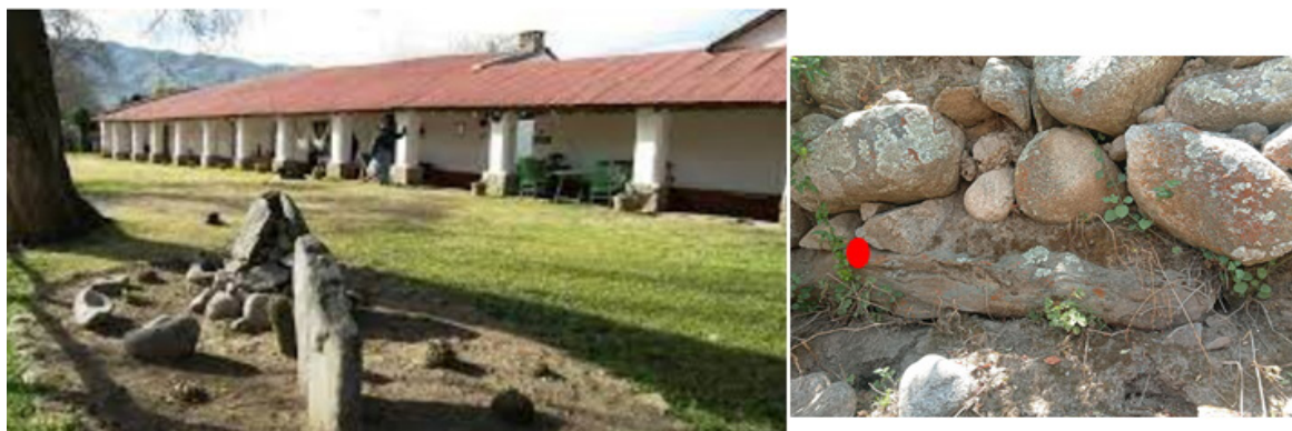
Figura N° 1. A la izquierda, el frente del casco de la Estancia de Los Cuartos con la exposición de conanas y dos estelas; la que aparece en el centro, adelante, recién se “desenterró” en los comienzos de la década de los 90. A la derecha, sector de pirca (muro de piedra) adonde los pobladores locales escondieron una Piedra Larga (marcada con un punto rojo) en tiempos de la dictadura cívico-militar de los 70, localidad de Casas Viejas.