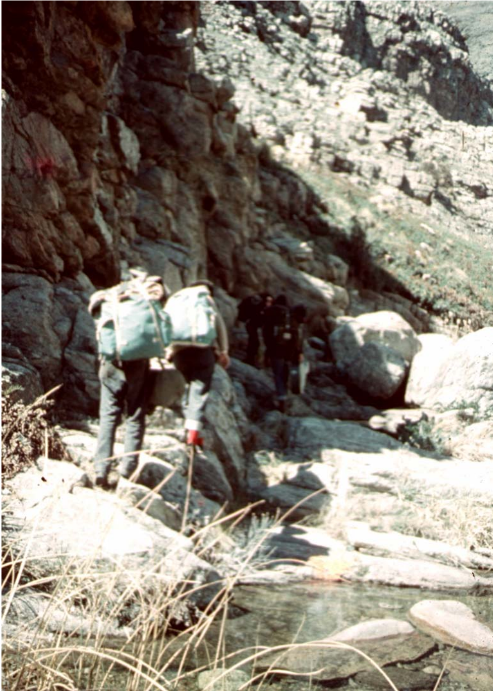
Fig. 2 Prospecciones en Sierra de la Ventana en 1967.