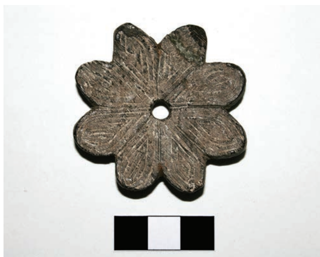
Figura 3b: Tortero; Patrimonio del ME, FFyL, número inventario -28374- (1408)

Figura 3a: Tortero; Patrimonio del Museo Etnográfico “Juan B. Ambrosetti” (ME), Facultad de Filosofía y Letras, Universidad de Buenos Aires (FFyL, UBA), número inventario -28331- (1260).szx