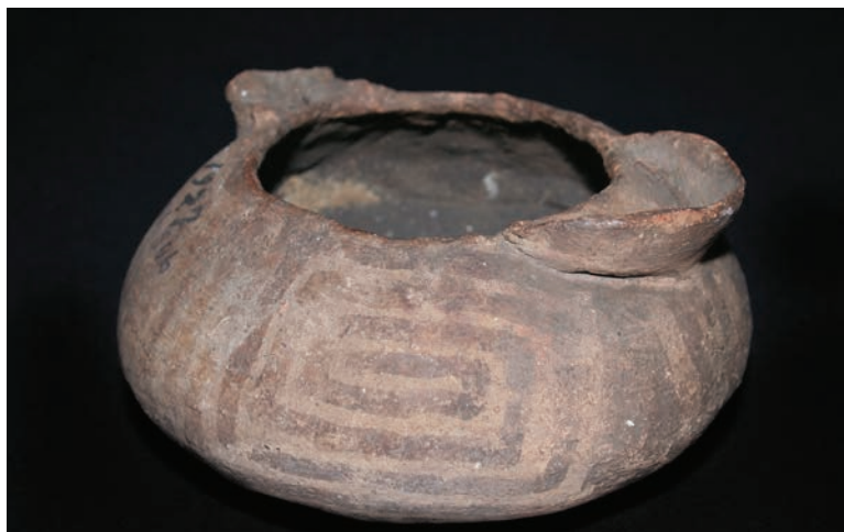
Figura 4: Vaso libatorio, medidas: 6,2 cm (alto) x 12,3 cm (diámetro) x 12,3 cm (diámetro); Patrimonio del ME, FFyL, número inventario -28766- (1927)

Son cuencos cerámicos de tamaño medio pintados, y muchas veces decorados en relieve, que poseen un agujero en el borde del labio (Figura 4) y que Ambrosetti 64 les atribuye la función ritual de efectuar libaciones. Por lo general fragmentados, fueron encontrados en 21 sepulcros y en un contexto tipo hallazgo (Tabla 2), sumando 23 piezas. Se hallan en 5 tumbas individuales, dos de ellas asignadas a mujeres (Tabla 3).