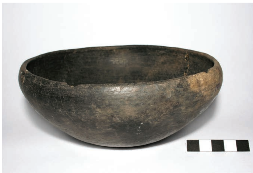
Figura 5: Pucos negro; Patrimonio del ME, FFyL, número inventario -28400- (1024)