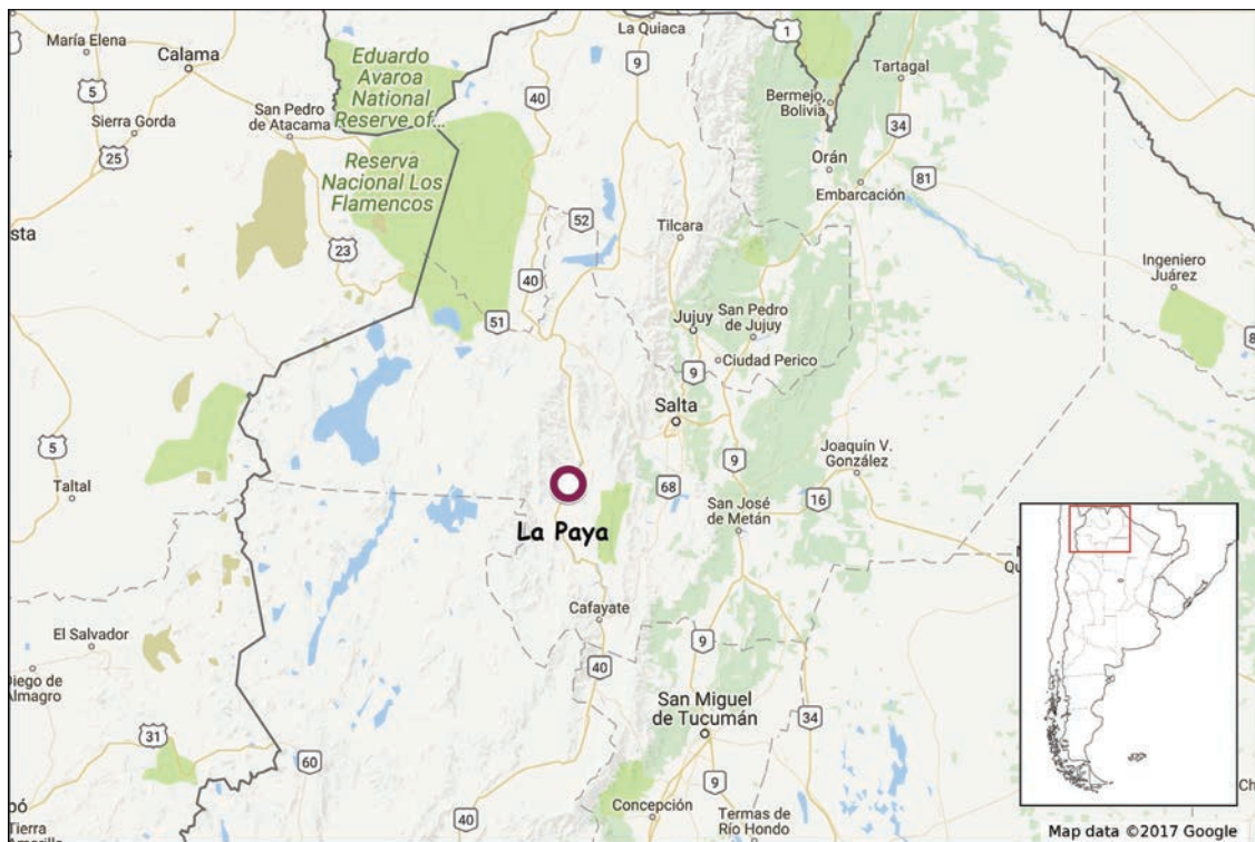
Figura 1: Mapa del área de estudio, detallando la ubicación de la localidad de La Paya

Ubicada en el departamento de Cachi, provincia de Salta, la localidad de La Paya, conocida también como Puerta de La Paya se caracteriza por ser un asentamiento conglomerado de momentos de Desarrollos Regionales (850-1470 DC) con construcciones incaicas posteriores (1470-1536 DC). Se localiza sobre una extensa terraza en la margen derecha del río Calchaquí y frente a la desembocadura de la Quebrada de La Paya (Figuras 1 y 2). Presenta una superficie aproximada de 6 hectáreas, una muralla de circunvalación de pircado doble, recintos de paredes de piedra rectangulares adosados, cistas subcirculares y vías de circulación interna.