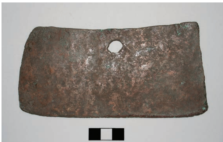
Figura 6: Placa pectoral; Patrimonio del ME, FFyL, número inventario -28344- (1284)

Son delgados objetos de bronce con forma rectangular en la mayoría de los casos y agujeros de suspensión (Figura 6) y cuya función sería ornamental. De entre los objetos de metal, son los más comunes en los sepulcros 84 y son más frecuentes en la Ciudad 85 (Tabla 2). Por tal motivo “esto nos probaría indirectamente que en la ciudad se enterraron en proporción más hombres que mujeres” 86 . Una vez más, no hay una explicación entre la asociación entre placas pectorales y los quehaceres masculinos.