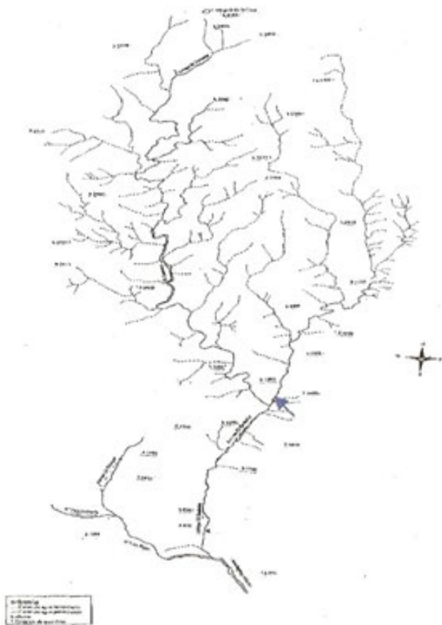
Figura 2: Hidrografía de la cuenca de estudio (Salas, 1997)

sencia de Podocarpus parlatorei “pino del cerro” (Perea et al. , 2007).