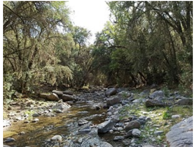
Figura 4: Estación de muestreo, arroyo Los Pinos