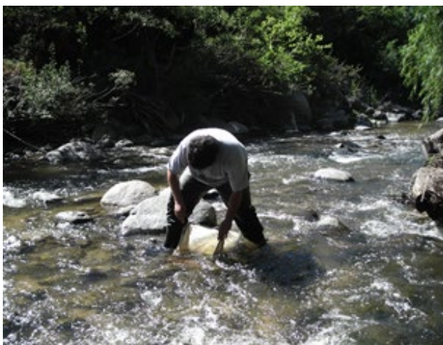
Figura 5: Muestreo con red tipo Surber