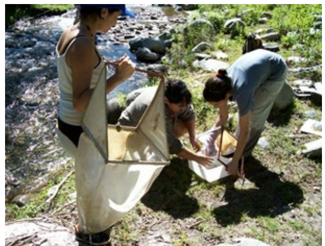
Figura 6: Acondicionamiento de las muestras

dice BMWP' alcanzó un valor de 155; ASPT' fue igual a 6,20; EPT representó el 47,54%; EPT/ Chironomidae fue igual a 1,73 mientras que Baetidae/Ephemeroptera fue igual a 0,68 (Tabla 1).