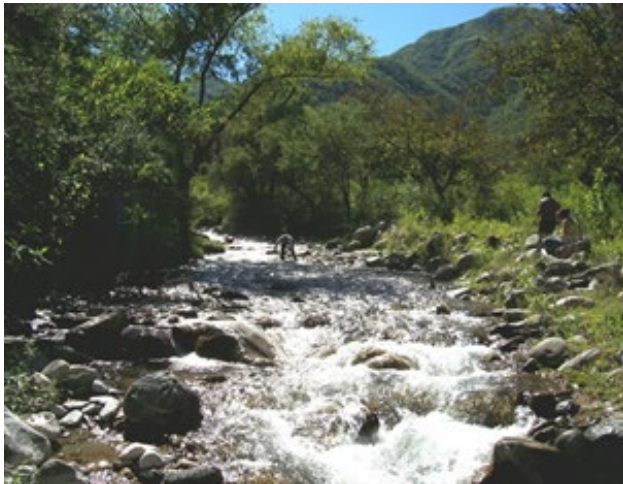
Figura 3: Estación de muestreo, arroyo El Arbolito