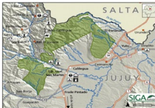
Figura 1. Localización de San Francisco