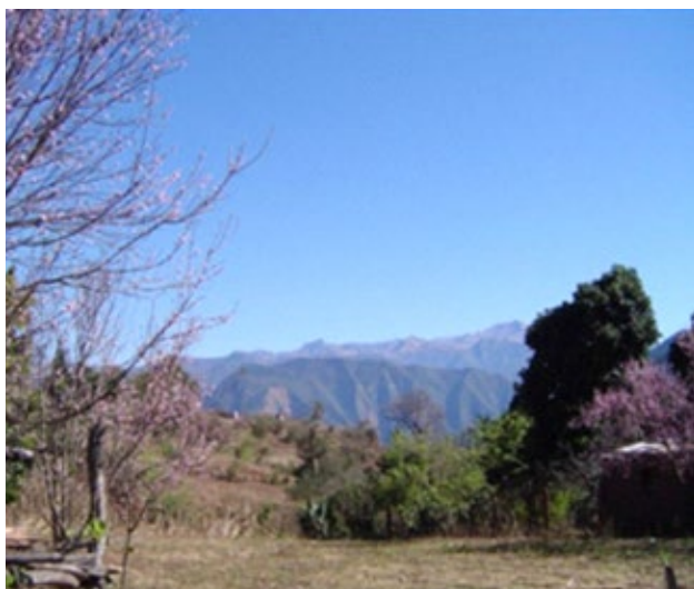
Fig.2. Vista de Zona Urbana San Francisco

Sólo Valle Grande posee escuela secundaria de alternancia. En cuanto a los servicios básicos, poseen luz provista por grupos electrógenos, agua corriente y pozos ciegos, y en todos los casos gas envasado.