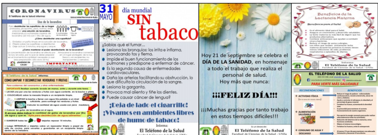
Figura 1. Materiales educativos: folletos.