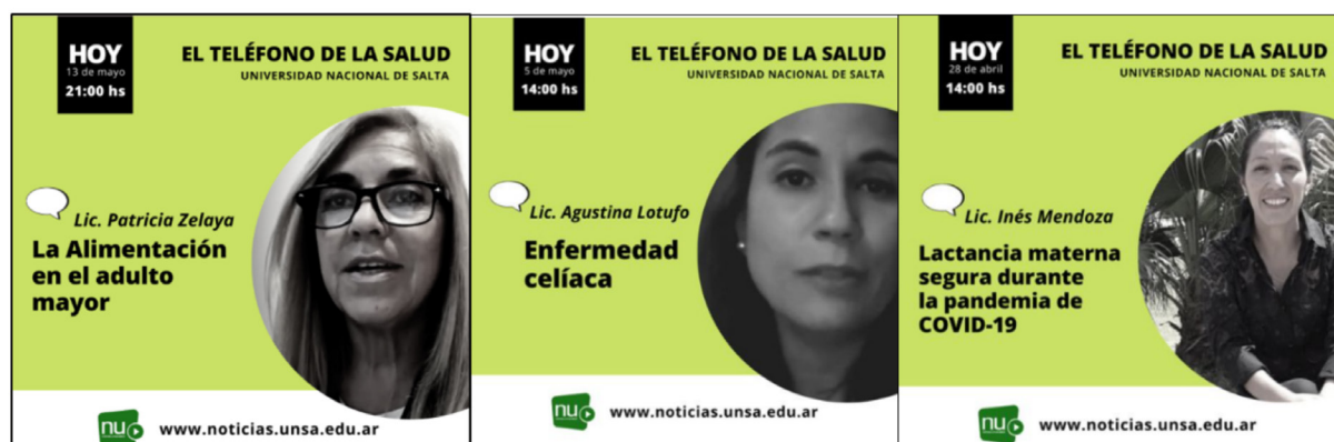
Figura 2. Imágenes de algunos de los videos transmitidos por “Noticias Universidad”

Ante la situación sanitaria de septiembre del 2020 y el colapso de los sistemas de atención de salud, las autoridades de la Facultad de Ciencias de la Salud de la Universidad Nacional de Salta en conjunto con Docentes de la Carrera de Medicina y de Nutrición a través de las autoridades del Servicio “El Teléfono de la Salud”, de la Directora del Servicio Kioscos Saludables y la