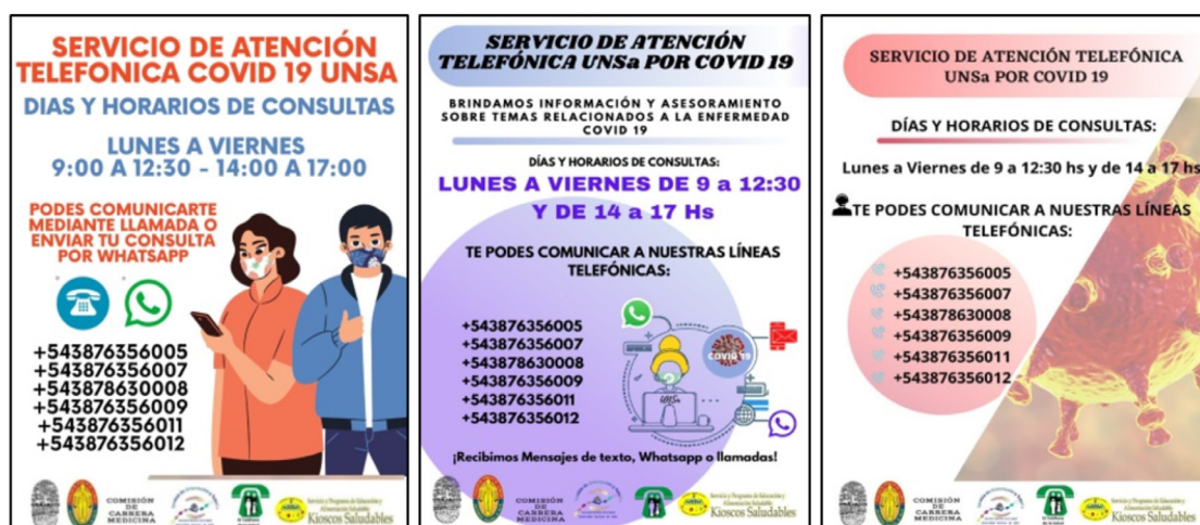
Figura 4. Folletos para la promoción del Servicio de atención telefónica COVID 19 UNSa.

Las acciones de capacitación permiten entablar relaciones interpersonales y grupales en las que se enfatiza la participación, el intercambio y la cooperación mutua. Además, permiten educar a la comunidad, con el objetivo de empoderarla con respecto a su salud.