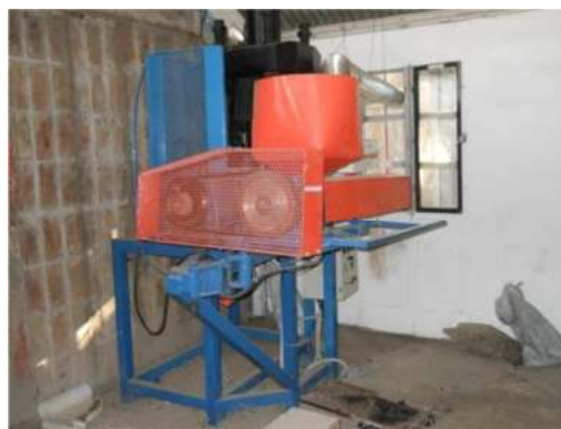
Figura 2: Máquina extrusora