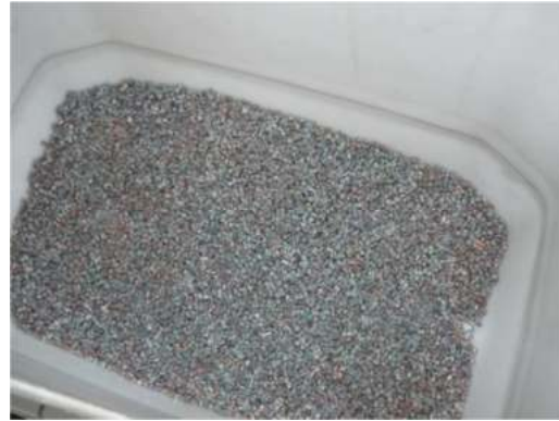
Figura 4: Partículas de polietileno