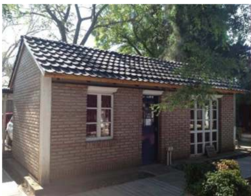
Figura 1: Vista del prototipo

La mezcla caliente que sale de la extrusora se vuelca sobre la matriz (Figura 5) y finalmente se acciona la prensa para que descienda el molde superior aplicando fuerza sobre la pasta. El proceso dura aproximadamente durante cinco minutos, tiempo en el cual la pasta se endurece manteniendo la forma deseada. La teja debe ser colocada en un bastidor para que en su proceso de enfriamiento no se deforme. Luego del moldeado, la teja presenta rebabas de material que deben ser cortadas y retiradas. Luego de esto, la teja está terminada (Figura 6).