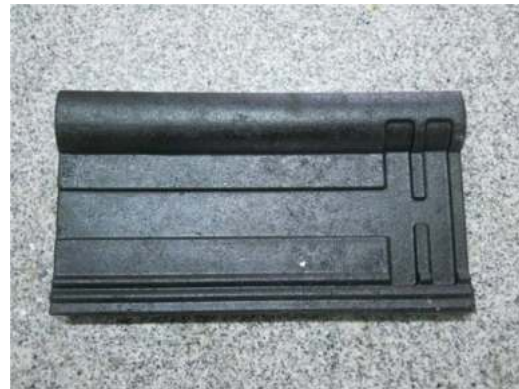
Figura 6: Teja terminada

Un procedimiento adicional opcional en la fabricación de las tejas consiste en el recubrimiento de las mismas con aditivos retardantes de llama. Las tejas sin recubrimiento tienen escasa resistencia al fuego, puesto que es conocido que tanto el caucho como el polietileno son materiales de fácil combustibilidad, y que emiten gases nocivos para la salud. Por esta razón se realizó una investigación en la institución CEVE experimentando con diferentes recubrimientos con aditivos retardantes de llama existentes en el mercado, y se realizaron ensayos de inflamabilidad según la Norma IEC 60695-2-11, denominada Ensayo del Filamento Incandescente. Finalmente, estableció que el material constitutivo de la teja es apto desde el punto de vista de la Inflamabilidad, cuando está recubierto con alguno de los siguientes recubrimientos: esmalte sintético negro mezclado con polvo de bórax; pintura intumescente marca Venier; y esmalte sintético negro mezclado con arena (Peisino et al, 2017).