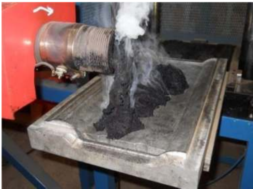
Figura 5: Mezcla caliente sobre matriz