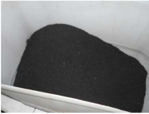
Figura 3: Partículas de caucho