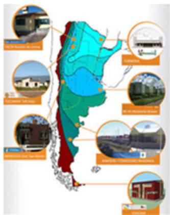
Figura 5: Esquema de localizaciones de prototipos bioclimáticos del proyecto GEF.