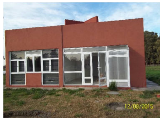
Figura 4: Estado de avance de una de las viviendas bioclimáticas de Tapalqué.

Por su parte, es de resaltar el desarrollo de un proyecto GEF (Global Environment Facility) encarado por el Estado Nacional, el cual cuenta con una donación cercana a los diez millones de dólares por parte del Banco Mundial que se aprobó en 2012 y que prevé la construcción de 128 viviendas bioclimáticas en Salta, Tucumán, Formosa, Mendoza, Buenos Aires, Chubut y Tierra del Fuego (ver figura 5). Para cada provincia se ha elaborado un prototipo que tiene en cuenta las condicionantes climáticas, desarrollado por los respectivos Institutos Provinciales de Vivienda de cada provincia.