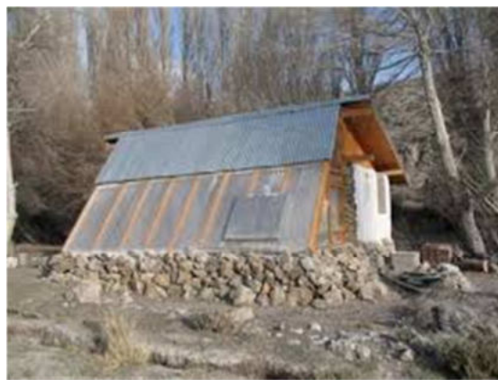
Figura 6: Vivienda Bioclimática Champa (Tecka, Chubut).

Por otro lado, es de destacar que en la Provincia de San Luis se ha inaugurado en el corriente año un barrio bioclimático de 33 viviendas, denominado “ex Scac” (Figura 7). Las viviendas cuentan con doble muro, aislación térmica, paneles fotovoltaicos y térmicos. Dado que la noticia es muy reciente, no abunda información respecto de los mecanismos de asignación de las viviendas, costos y resultados en operación de las mismas, pero se convierten en un caso a seguir en el largo plazo para evaluar su comportamiento. 5