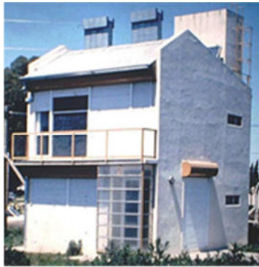
Figura 1: Prototipo Solar de La Plata.