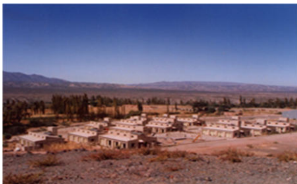
Figura 3: Barrio Solar en Chachi.

Por su parte hay que destacar el inicio de la construcción de cuatro prototipos bioclimáticos impulsados por el IIPAC, el Instituto de la Vivienda de la Provincia de Buenos Aires (IVBA), INTI y el Municipio de Tapalqué. Dicho emprendimiento inició el proceso constructivo en 2010, pero a la fecha no ha logrado concretarse y su estado de avance es del 75% aproximadamente en tres viviendas y una está a punto de ser finalizada (Figura 4). Debido a cambios en la gestión del Instituto de la Vivienda y en el municipio, el proyecto se vio demorado. Actualmente perdió apoyo económico, al no encontrarse entre las prioridades de la gestión.