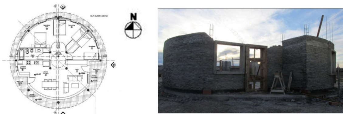
Figura 8. Izquierda: Planta de una vivienda. Derecha: Avances en la construcción.

En el caso de las siete viviendas de la comunidad Mapuche Tehuelche Willi Pu Folil Kona (Raíces Jóvenes Guerras del Sur), para el diseño de las mismas se realizaron una serie de talleres con participación de técnicos del IPV y el conjunto de familias que componen la Comunidad (ver figura 8). En tal sentido se privilegiaron aspectos culturales que incluyen la disposición de la vivienda en una planta circular con la entrada hacia el Este, manteniendo el criterio ancestral de la “ruka”, casa de los pueblos originarios. Tal como señala De Benito (2015): “los Mapuches eran nómades y cuando venían al territorio hacían sus viviendas de forma oval o redonda y lo cubrían con cuero de guanaco y siempre trabajaban con piedra, con tierra”. Asimismo, se respetó la configuración central de la casa, el cual es el lugar de los fuegos y es el lugar donde “se van los malos espíritus” (De Benito, 2015), por lo cual se le respetaron las cuatro columnas centrales y en la parte superior se colocó una lucarna, que hace las veces de chimenea. Por su parte, los muros se ejecutan en piedra de pórfidos de la zona, la cubierta se ejecutará con paja y además se incorporaran al diseño muros acumuladores de calor y colectores solares de agua.