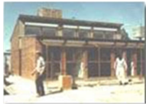
Figura 2: Prototipo bioclimático en Tunuyán.

Entre 1983 y 1985 se construyó en Cachi (Salta) el barrio solar “FONAVI 15 viviendas” que fue el primer conjunto bioclimático construido en Argentina. Su comportamiento fue exitoso, sin embargo, actualmente el mismo se ha ido deteriorando por falta de mantenimiento y monitoreo estatal (Ver figura 3).