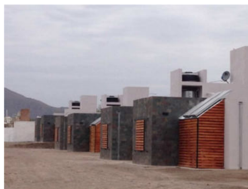
Figura 7: Viviendas bioclimáticas en el barrio “ex Scac”, en la ciudad de San Luis.