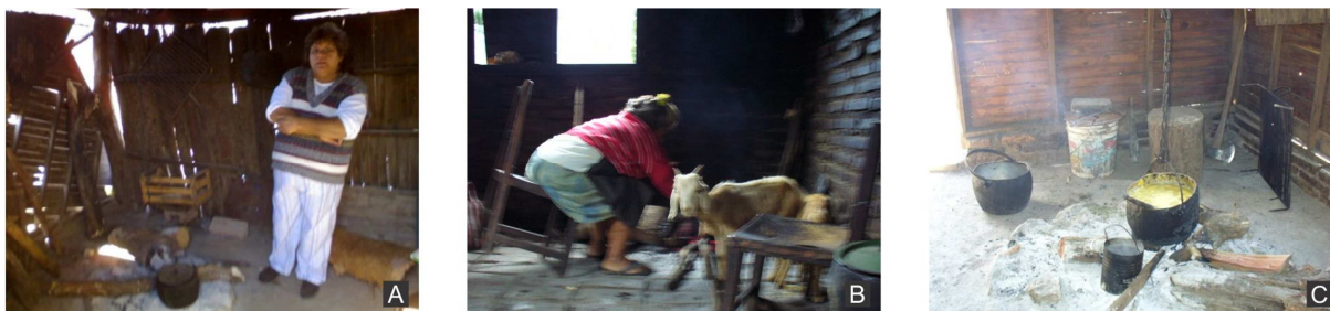
Figura 2. A) fogón sobre piedras en el suelo. B) fogón en el suelo, postura incomoda para cocinar. C) fogón en el suelo, con ollas colgando desde el techo mediante cadenas. Nótese el uso del fogón con dos recipientes a la vez.

Otro hábito generalizado es el de colocar dos recipientes en el fuego. En uno se cocina mientras que en el restante se calienta agua. La Figura 2 ilustra esta costumbre. En la olla colgada se cocina, mientras que en un recipiente secundario, apoyado directamente sobre el fogón, se calienta agua.