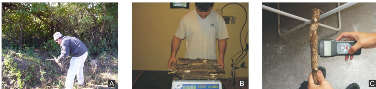
Figura 4. A) recolectando muestras de leña. B) pesando leña. C) medición de la humedad.

A continuación se realiza una breve descripción de cada una de las pruebas realizadas.