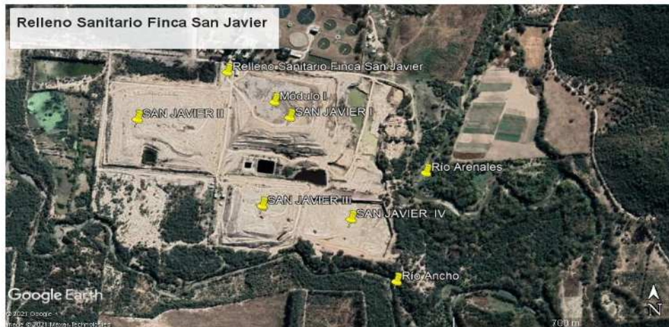
Figura 1. Ubicación del relleno sanitario y sus Módulos en la Ciudad de Salta.

de residuos en el período 1986 a 1998) y actualmente; Módulo II (aproximadamente 19 has, altura de 12 m, operado durante el período 1999 a Junio 2011); y Módulo III (9 has, cota aproximada de 12 m, en operación desde Junio 2011 hasta aproximadamente 2015). El Módulo de San Javier II tiene instalado un sistema de captura activa de biogás con tuberías verticales que transportan el biogás hasta la planta de combustión. El sistema consiste en aproximadamente 100 tubos verticales de los cuales se encuentran en funcionamiento la mitad. El biogás capturado es transportado a la planta de combustión previa separación de condensados. (Blanco et al, 2017).