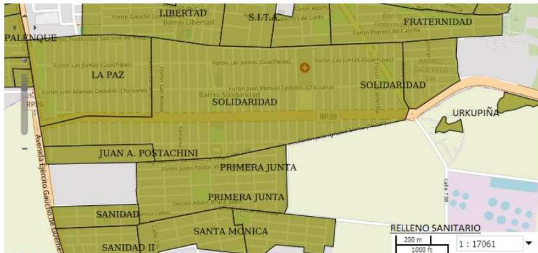
Figura 1. Barrios en el Área de Influencia directa del relleno sanitario (Municipalidad de Salta)