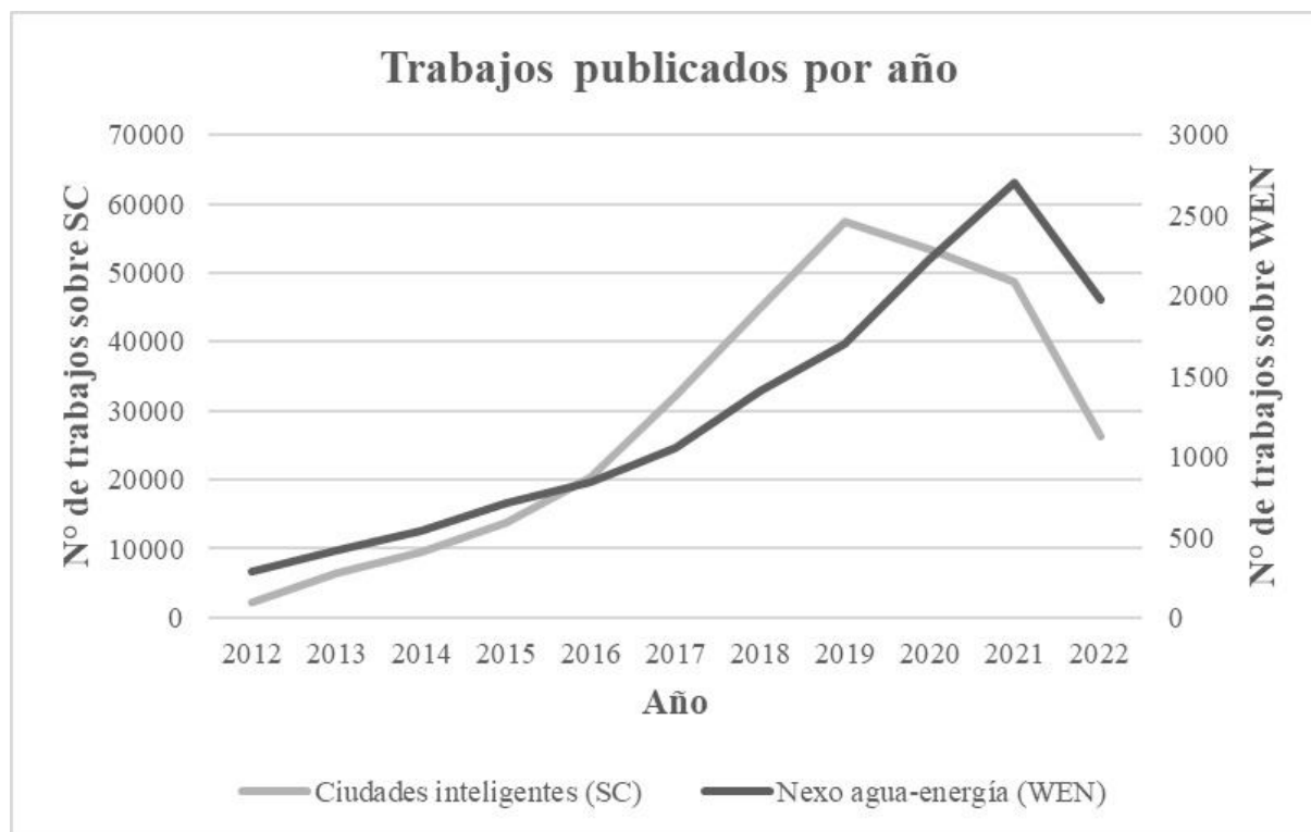
Figura 2: Evolución temporal de los conceptos “Nexo Agua-Energía” y “Ciudades Inteligentes”. Agosto 2022. WEN: nexo agua energía; SC: smart cities.

anteriores casos. Tanto así que, por ejemplo, para el año 2012 se encontraron 2.080 trabajos sobre SC, 285 trabajos sobre WEN y solo 1 trabajo que aborda ambos temas. Sin embargo, en los tres casos existe un ascenso continuo e importante en el número de trabajos a través de los años, ya que para el año 2021 se encontraron 26.300 sobre SC, 1.980 sobre WEN y 68 trabajos de WEN y SC. Esto da cuenta de que no solo el nexo y las SC (por separado) se consideran cada vez más relevantes para los investigadores, sino que, además, el enfoque de nexo parece ser cada vez más elegido para abordar el estudio de los sistemas de agua y energía en las SC.