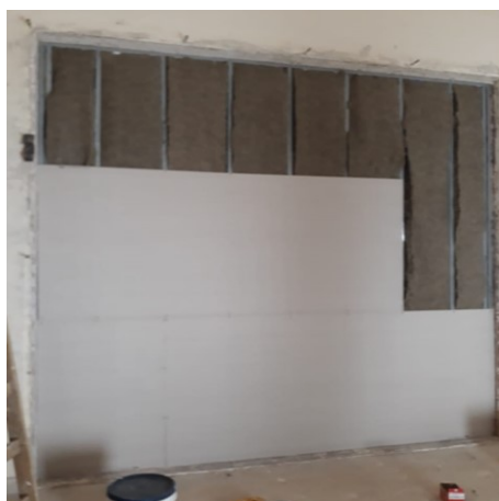
Figura 3: Ensayo en cámaras de transmisión del Laboratorio LAL-CIC

masilla. El perímetro de ambas caras, en el contacto con el marco de ensayo, se selló con silicona. En la Figura 3 se muestran detalles constructivos de uno de los tabiques instalados en las cámaras de transmisión horizontal inferiores del laboratorio.