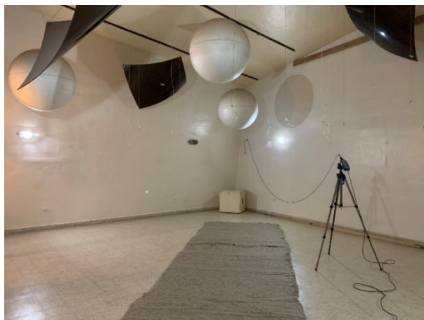
Figura 1: Ensayo en cámara reverberante del Laboratorio LAL-CIC de mantos de lana de oveja

De acuerdo con lo establecido en la norma IRAM 4065 cada material fue colocado sobre el piso de la cámara formando un rectángulo de aproximadamente 10 m 2 . En la Figura 1 se puede apreciar la disposición de ensayo del manto de 35 mm de espesor.