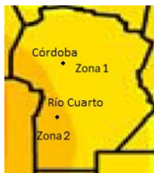
Figura 2: Irradiación solar anual sobre plano inclinado óptimo en la provincia de Córdoba. Se observan las dos zonas de radiación solar.

Para todas las zonas definidas mediante los valores de GTI, se usó la GHI correspondiente a la estación más cercana a la localidad con mayor potencia instalada y mayor población (UNLu, 2025). La Figura 2 reproduce un mapa de radiación solar publicado en un artículo de Grossi Gallegos y Righini (2011). La provincia de Córdoba cuenta con tres zonas diferenciadas de radiación, dos de las cuales están identificadas en la Figura 2. La zona 1 es la más abarcativa y representativa en cantidad de potencia instalada, la zona 2 es la de mayor radiación solar y ocupa el suroeste de la provincia, existe una tercera zona más al norte, en donde no hay instalaciones declaradas. La zona 1 cuenta con 143 localidades diferentes y la zona 2 con 19.