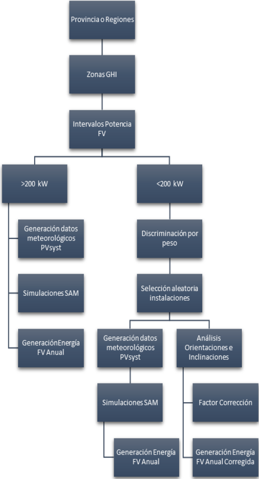
Figura 3: Diagrama de procesos para obtener la estimación de energía generada anualmente por todos los usuarios-generadores.

Por último, se calculó la producción específica anual (kWh/kWp.año) para cada zona GHI sumando la energía generada y la potencia total del parque fotovoltaico. La Figura 3, presentada a continuación, detalla este proceso.