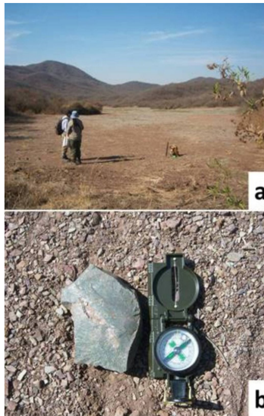
Figura 7. Sector La Falda. a) Vista de inicio de una de las transectas de prospección. b) Material lítico, hallazgo en situ.

Se recolectó en su mayoría material lítico (N=17), que se hallaba concentrado en una superficie de 10 m 2 . Aunque también se registraron hallazgos aislados como una punta de proyectil de obsidiana de tamaño pequeño, de tipo triangular alargada con pedúnculo (removido) diferenciado y aletas entrantes, estas últimas fracturadas al igual que el ápice. La forma de los lascados es escamoso irregular. Además, se suma un desecho de talla de tamaño pequeño en el mismo material, también como hallazgo aislado. El resto de las piezas fueron realizadas en areniscas de color verde y gris (N=12) y en pelitas de grano fino (N=3). Predominan los artefactos de tamaño muy grande y grande. Hay un núcleo con extracciones irregulares, una forma base lasca con extracciones también irregulares. En la categoría instrumentos (N=2), se halló un ejemplar compuesto (raspador + muesca) y un cuchillo, así como dos filos naturales con rastros complementarios. Las formas-base que predominan son lascas con dorso y talón natural. Los desechos de talla son de tamaño pequeño y muy grandes (Figura 7b). Solamente se observó un fragmento cerámico del tipo alisado, sin decoración y erosionado. En el sector más oriental del área prospectada se registró, sobre una pequeña elevación que fue rodeada por los trabajos de arado, un conjunto de estructuras realizadas en piedra de tamaño mediano, dispuestas en forma de una línea corta de dos m y otra de forma circular, de dos m de diámetro.