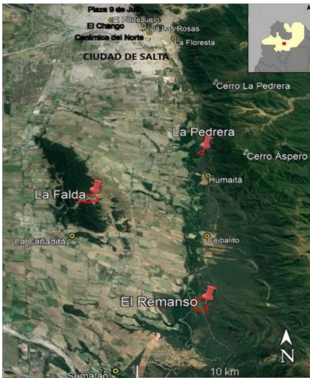
Figura 1. En color rojo, la ubicación de los sectores prospectados. En amarillo, la probable ubicación de sitios mencionados en la Tabla 1.

Se exponen los resultados obtenidos en tres micro-sectores prospectados (Figura 1). En todos los casos se realizaron en áreas llanas suavemente inclinadas, de origen aluvial, con pendiente media. Estas presentan un suelo bien drenado sin limitaciones fisicoquímicas, con fertilidad medianamente baja (discreta) (Vargas Gil, 1999). El área ha sido fuertemente impactada por la presencia y manejo de ganado vacuno, la extracción de mantillo que se vende posteriormente como abono para las plantas, y la explotación agrícola. Esto provocó erosión de suelo y posible remoción de material arqueológico.