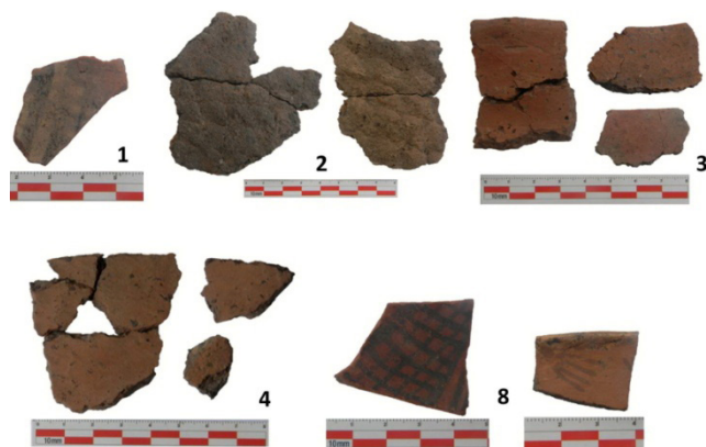
Figura 4. Grupos cerámicos definidos para El Remanso: 1) Santa María negro sobre crema. 2) Corrugados. 3) Alisados con engobe rojo. 4) Alisados. 8) Pulidos Inca.

Sobre una de las bajadas de agua, se efectuó el rescate de una vasija corrugada que se encontraba fragmentada e incompleta. Los trabajos de remontaje en laboratorio permitieron reconocer una pieza de base subcónica y cuerpo subglobular, borde levemente evertido y labio redondeado, con un asa otomorfa con las puntas orientadas hacia abajo, adherida y localizada en el borde. La porción reconstruida presenta treinta y ocho cm de altura y una superficie externa corrugada de manera uniforme mientras que la interna está alisada. En su interior se encontraba un artefacto de piedra, con uno de los extremos pulidos, no se recuperaron restos óseos (Mamani y Castellanos, 2019) (Figura 5).