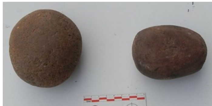
Figura 6. Material lítico del sector El Remanso.

Los instrumentos que presentan pulido y picado son un fragmento de mano de moler en granito, un pulidor de cuarzo, un sobador en arenisca de Formación Pirgua, y sobre una materia prima no determinada, probablemente arenisca, un fragmento de hacha, un percutor, y un ejemplar compuesto (percutor + yunque) (Figura 6).