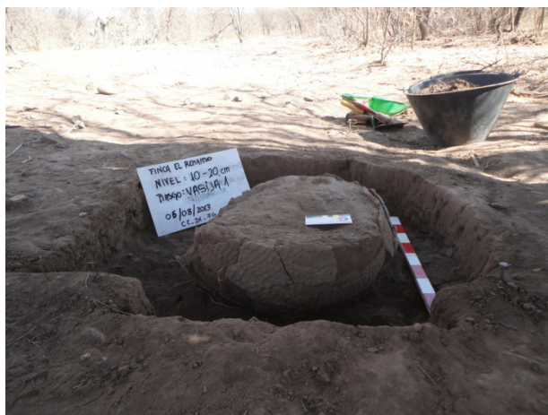
Figura 5. Rescate de vasija corrugada en el sector El Remanso.

Sobre una de las bajadas de agua, se efectuó el rescate de una vasija corrugada que se encontraba fragmentada e incompleta. Los trabajos de remontaje en laboratorio permitieron reconocer una pieza de base subcónica y cuerpo subglobular, borde levemente evertido y labio redondeado, con un asa otomorfa con las puntas orientadas hacia abajo, adherida y localizada en el borde. La porción reconstruida presenta treinta y ocho cm de altura y una superficie externa corrugada de manera uniforme mientras que la interna está alisada. En su interior se encontraba un artefacto de piedra, con uno de los extremos pulidos, no se recuperaron restos óseos (Mamani y Castellanos, 2019) (Figura 5).