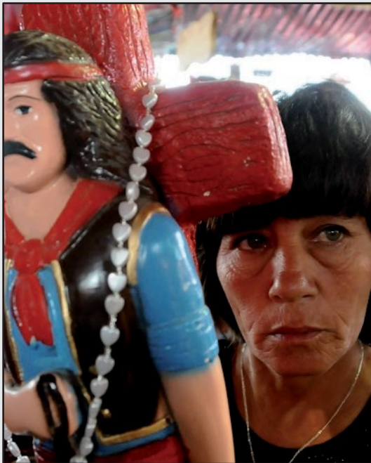
FIGURA IX. J. P. Faccioli. “Devotos 5”. Gauchito Gil. 2008/2009

De allí, las fotografías van a tender a mostrar momentos de intimidad devocional e interacción de los fotografiados con la cámara. Desde estas nuevas posiciones los fotógrafos construyen retratos donde la carga emotiva se acentúa. Predominan recortes y primeros planos que ayudan a distinguir, resaltar a cada uno de los sujetos y los objetos que implican y hacen a la conmemoración (figura VIII). Además, este modo de visualizar se desarrolla guiado por esa forma teatral patética, que se recrea de manera repetitiva en cada toma con el fin de alcanzar máxima expresividad, más aún en ciertos momentos cumbres de la festividad (figura IX).