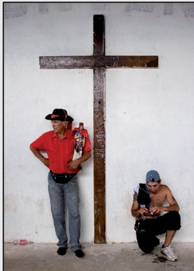
FIGURA XI. G. Rusconi. Foto S/T. Gauchito Gil. 2008/2011.

La foto que sigue nos muestra un momento en el que dos peregrinos “descansan”, quizá luego de haber realizado una cola para saludar al santo, o tal vez “aguardan” algo o a alguien para ingresar a otra escena; uno de ellos inclusive repasa, desde el visor de su cámara, fotografías. Quizá, sean las imágenes tomadas en alguno de esos “instantes decisivos” del ritual (figura XI).