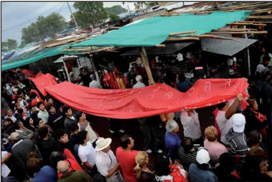
FIGURA VII. J. P. Faccioli. "Banderas rojas a tu corazón". Gauchito Gil. 2008/2009.

En términos generales, los conjuntos de ambos fotografías se orientan a buscar un descentramiento de la mirada de esos momentos pautados y jerarquizados dentro de la agenda de la fiesta (de esos lugares donde sobresale el protagonismo de una delegación, el presidente de una asociación, la municipalidad o la iglesia).