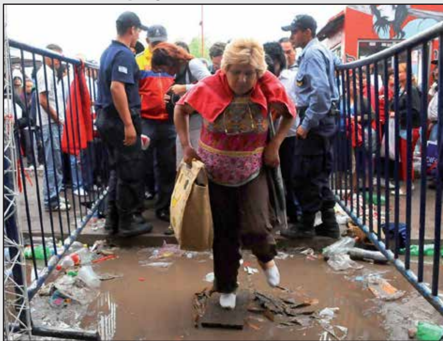
Figura III, J. P. Faccioli. “Entrada al santuario”. Gauchito Gil. 2008/2009

La selección, el orden de las imágenes y la interacción de las fotos con los epígrafes lingüísticos —que sí están presentes en este caso— indican ciertas coordenadas espacio-temporales que posibilitan distinguir la línea de acción de los personajes y posición del fotógrafo a lo largo del conjunto. De allí, la propuesta inicia con el retrato de una devota que salta un charco de barro entre las vallas policiales para ingresar al santuario a saludar la iconografía central del Gauchito; a lo que el pie de foto agrega que se trata de la “Entrada al santuario”. Luego las capturas nos ubican en el ambiente interior del santuario y, finalmente, se evidencia que el fotógrafo recorre algunos espacios externos cercanos a la peregrinación central de la Cruz Gil.