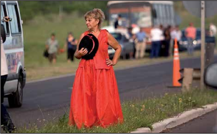
FIGURA X. G. Rusconi. Foto S/T. Gauchito Gil. 2008/2011.

cosa, algo, alguien, o sólo esperando, pensando, sintiendo, con la mano derecha que sostiene su sombrero aprisionado a su pecho. Ese cuerpo, esa mujer, se ve inmersa en el paisaje; lo marca y, a su vez, lo distingue (figura X).