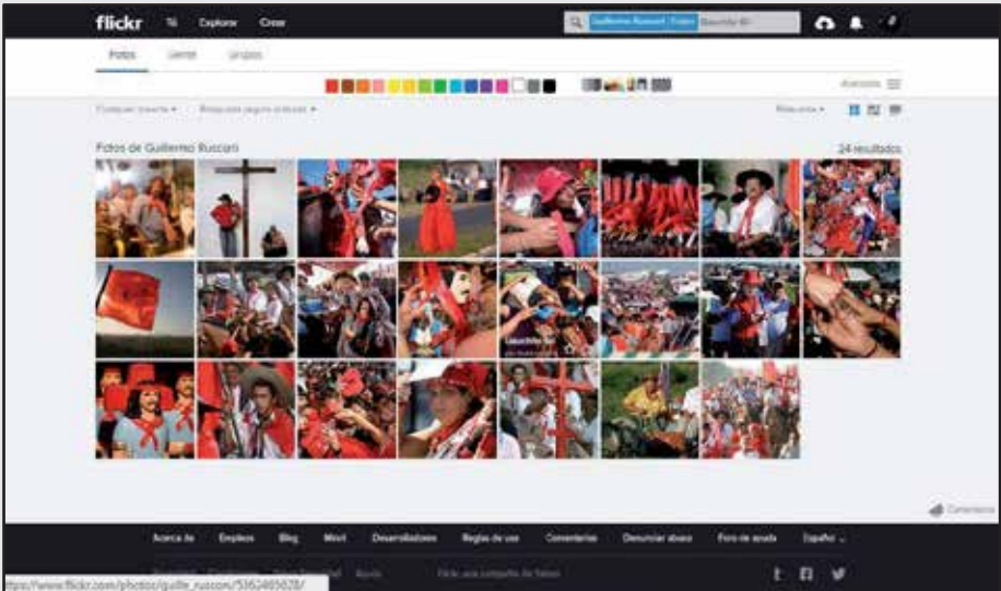
FIGURA II. Gauchito Gil. Flickr G. Rusconi oficial. Modo de vista mosaico.

A partir de estos materiales y recorridos, nos preguntamos: ¿cómo se construye el ‘Gauchito fotogénico’ y ‘diferencial’ en el discurso que despliegan los fotógrafos desde las entrevistas y los conjuntos fotográficos? ¿Esta ‘figuración’ de la manifestación devocional se vincula a los itinerarios de viajes fotográficos? ¿Es posible reconstruir en el abordaje contrastivo de los conjuntos visuales y relatos de fotógrafos los indicios de los trayectos de viajes? ¿Cuál es la incidencia de estas prácticas fotográficas atravesadas por constantes desplazamientos y formas de distanciamiento/acercamiento con lo retratado en