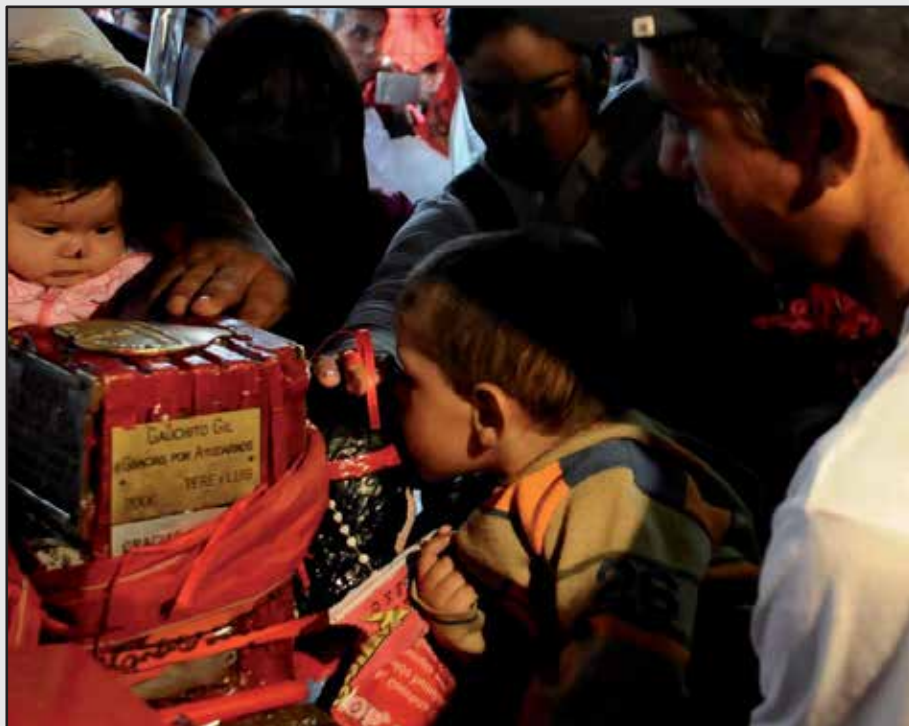
Figura IV, J.P.Faccioli. “Mi amigo el Gauchito”. Gauchito Gil. 2008/2009

1986) señalando el sentido espacio-temporal o proporcionando la identificación de los objetos o sujetos que aparecen en las fotografías. No obstante, algunos pies de foto se utilizan también como un recurso retórico que condensa la interpretación subjetiva del autor y complementa el punto de vista general del ensamble. Son los casos de los títulos: “Mi amigo el Gauchito” que expone en un plano a nivel un niño que besa la representación central de Antonio Gil en el santuario (figura IV), o “Banderas rojas a tu corazón” que muestra una toma en picado en la que se observa decenas de fieles transportando una bandera roja hacia el centro del santuario (figura VII).