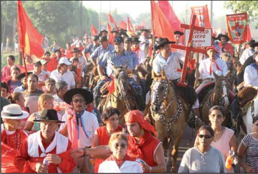
FIGURA VI. G. Rusconi. Foto S/T. Gauchito Gil. 2008/2011

tu corazón” (figura VII). Sin embargo, esta toma más allá de mostrar la masividad, hace hincapié en la acción de los devotos y el símbolo que transportan.