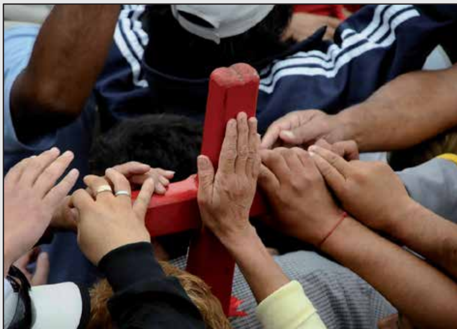
Figura V, J. P. Faccioli. “Cruz Gil”. Gauchito Gil. 2008/2009

El primer pasaje que se observa en las formas compositivas que agrupan los dos conjuntos desde el viaje de 2008 es aquel que evidencia un tránsito de la captura de lo colectivo a lo individual. Ambos fotógrafos sostienen que “lo que vende”, lo que los medios generalmente les piden es la “toma de multitud”, de la masividad y el comercio. Entonces el objetivo a partir de los últimos viajes era buscar algo diferente y ese pareciera ser el umbral que marca el cambio de miradas en ambos autores.