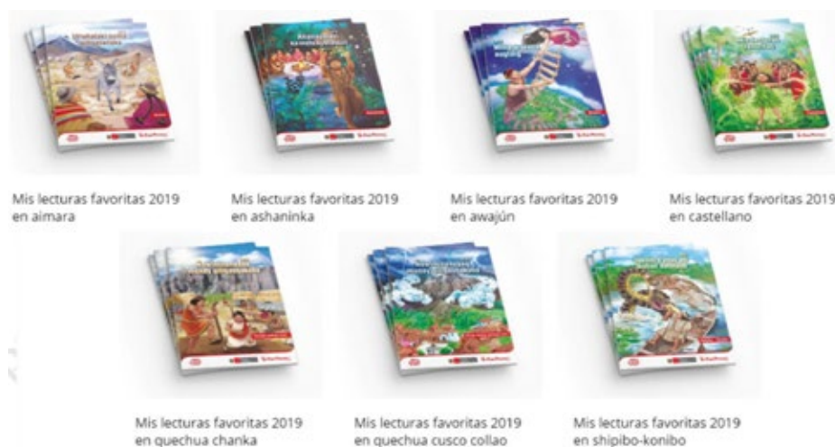
Figura 1: Mis lecturas favoritas