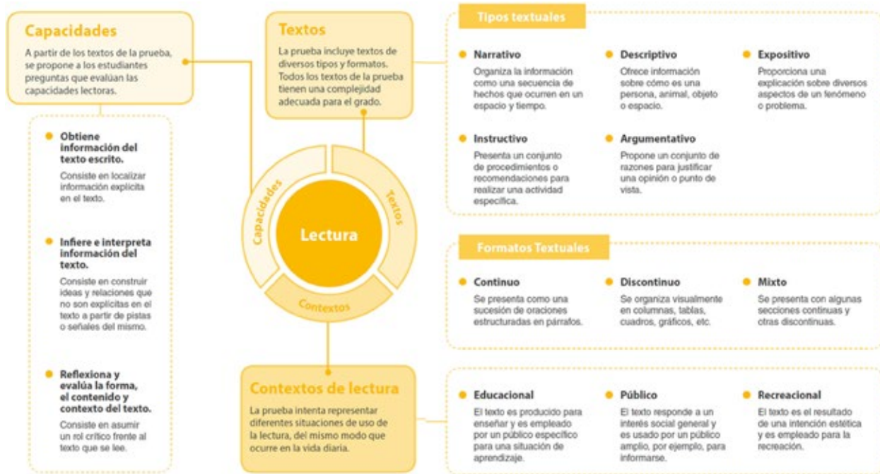
Figura 2: Elementos considerados en la construcción de las pruebas