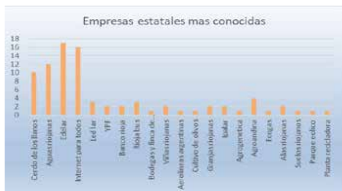
Figura N°2 – Conocimiento de empresas estatales riojanas.

Luego, se solicitó nombrar tres empresas estatales riojanas que conocieran. Las respuestas se muestran en la figura N°2.