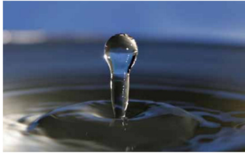
Figura 2: Campo y partícula.

Ante todo, aclaremos que existen dos concepciones distintas acerca de las “partículas elementales”. En la primera, se considera que ellas son las formas fundamentales de la materia. En la segunda, se considera que existen otros objetos fundamentales: los campos de materia cuyas excitaciones elementales son las partículas elementales. En la primera concepción, los campos se consideran cantidades auxiliares, útiles para el cálculo, pero sin contraparte en la naturaleza. Aclaremos que la diferencia entre ambas es sólo filosófica: las ecuaciones y predicciones físicas de ambas concepciones son idénticas.