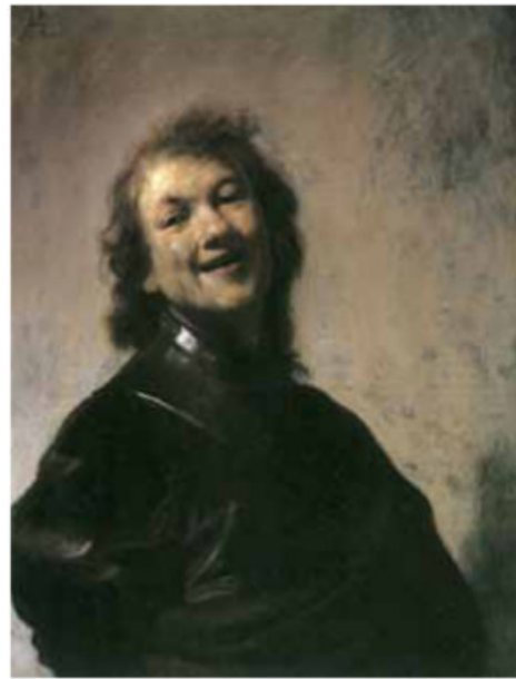
Figura 1: Leucipo y Demócrito: los creadores del atomismo.

Esta última, inspirada en el atomismo griego pero guiada por el conocimiento de la química, fue propuesta por Dalton y desarrollada durante el siglo XIX. Como durante el siglo XVIII se habían encontrado numerosos elementos químicos, Dalton imaginó átomos para cada uno de ellos. Éstos, además de forma, tamaño (no especificados) y posición, poseían propiedades químicas y reglas fijas de composición que explicaban las leyes conocidas de la Química. Los desarrollos posteriores mostraron que también se podían explicar las leyes de los gases y la estructura de los sólidos.