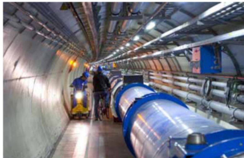
Figura 6: El túnel del LHC.

Para obtener noticias de estas intimidades (que no van a aparecer en un programa de "chimentos" por TV) es necesario observar un bosón de Higgs, que como es una gotita del campo, no sólo las conoce sino que las publica.