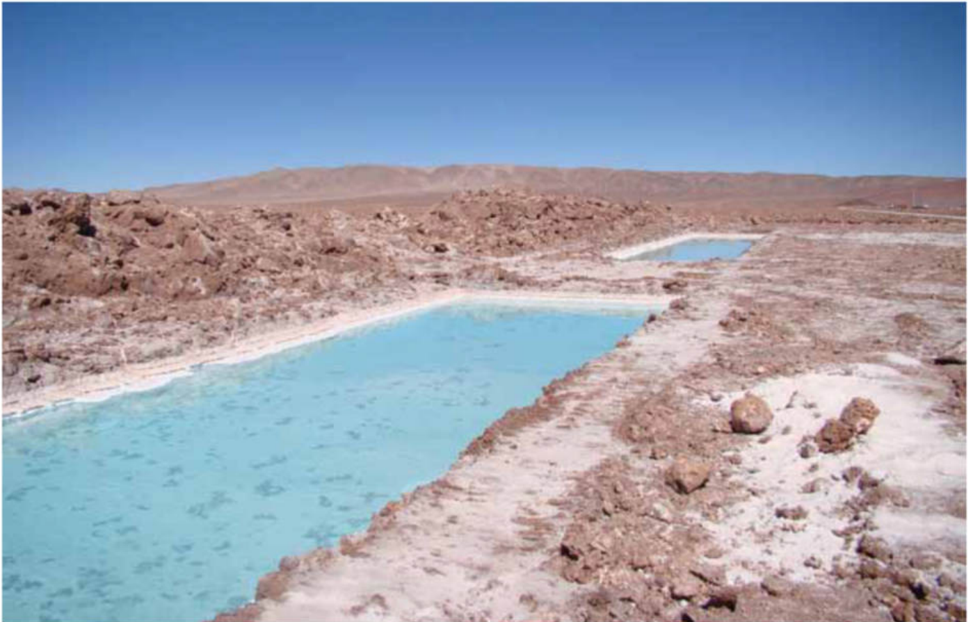
Figura 8: Piletones de prueba para evaporación en el Salar de Pozuelos, Provincia de Salta