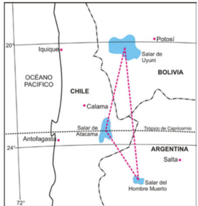
Figura 4: Triángulo del Litio en Sudamérica.

El crecimiento acelerado del uso del litio ha provocado que una tonelada de litio suba su precio desde 1.500 dólares que costaba en 2003 hasta su pico máximo de 5.200 dólares en 2009; actualmente su valor es de 4.300 dólares por tonelada.