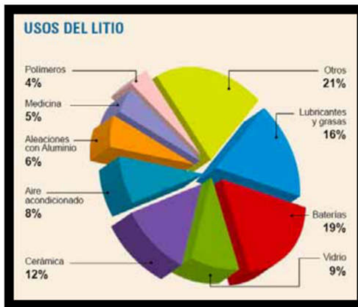
Figura 10: Usos del Litio.

El litio por sus propiedades físicas y químicas, es el más liviano y electropositivo de todos los elementos sólidos y ha logrado desarrollar en la actualidad un mercado diverso, que crece día a día. Es un elemento versátil, porque se comercializa y se usa como concentrado de mineral, metal y compuesto químico, orgánico e inorgánico (Figura 10).