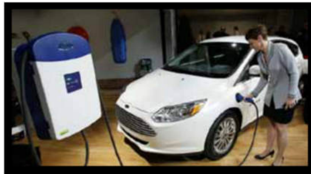
Auto a baterías de litio.

Actualmente un grupo de ingenieros e investigadores de la Universidad de Northwestern Illinois, en los Estados Unidos, ha desarrollado un nuevo tipo de baterías de iones de litio, con una capacidad diez veces mayor que las actuales y posibles de recargar diez veces más rápido, además de alargar su vida útil. Estas nuevas baterías podrían comercializarse en los próximos tres a cinco años, y no sólo para baterías de dispositivos electrónicos, sino también para vehículos eléctricos. Las ventajas de un auto eléctrico con estas baterías son que con el mismo tamaño y peso, podríamos tener 1.500 km de autonomía en lugar de 150 km, o bien con baterías mucho más pequeñas y ligeras, podríamos tener esos 150 km de autonomía y recarga en 48 minutos en lugar de 8 horas.