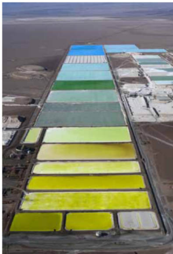
Figura 7: Piletones de evaporación en el Salar de Atacama, Chile.

Otro proceso de concentración es la adsorción mediante una membrana adsorbente selectiva de litio. Este proceso tiene la ventaja que no es afectado por la composición del agua salada (pueden tratarse salmueras con bajas concentraciones de litio) ni por las condiciones meteorológicas del lugar, y es amigable con el medio ambiente ya que no se generan muchos residuos, pero tiene la desventaja de que son necesarios reactivos químicos y el equipo de adsorción es caro y complicado de operar.