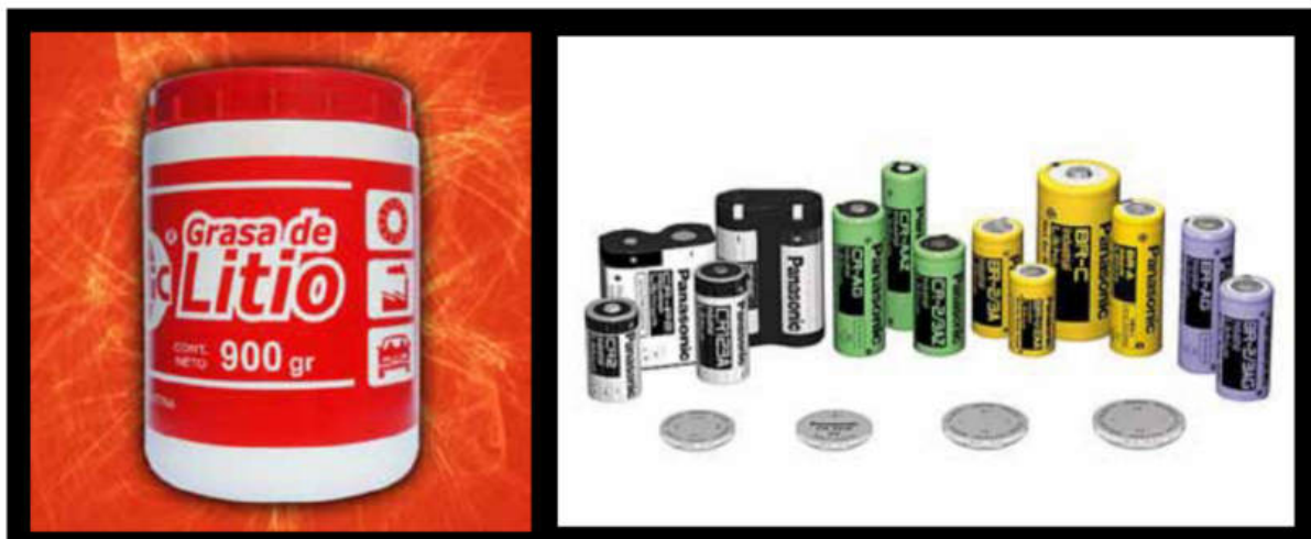
Grasa de litio. Baterías de litio.

El mayor consumo es en la forma de productos químicos inorgánicos, destacando el carbonato de litio y el hidróxido de litio. Algunos de sus usos son para manufactura de vidrios, producción de esmaltes para cerámicas, producción de aluminio metálico, ingrediente crítico en la fabricación de tubos de televisión, fabricación de grasas lubricantes de usos múltiples, obtención de litio metálico, absorbente de CO 2 en la industria espacial y submarinos, fuentes de energía eléctrica (baterías) y hasta para elaborar medicamentos.