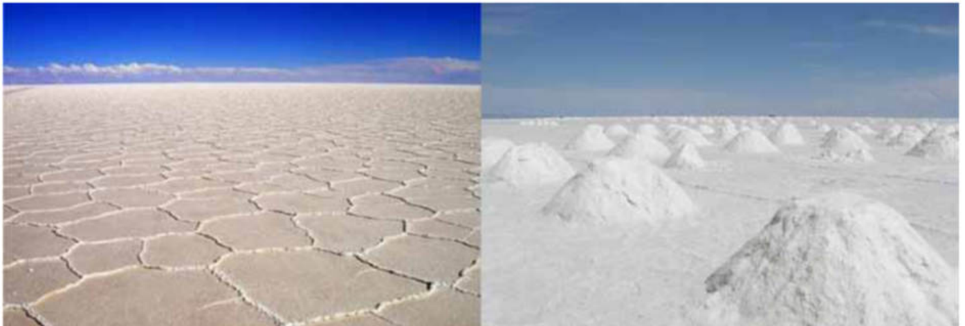
Figura 5: Salares de Atacama (Izquierda) y de Uyuni (derecha).