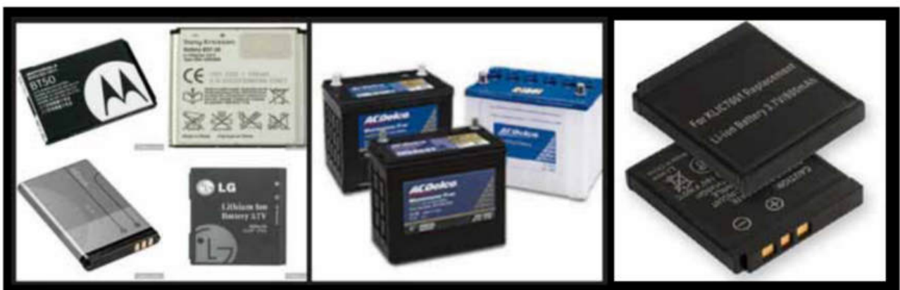
Baterías de litio.

De todos los usos aplicables del litio, las baterías son las que tienen mayor trascendencia debido a que constituyen la fuente de energía de los teléfonos celulares, notebooks, tablets, etc. Estos dispositivos están diseñados para almacenar energía eléctrica, que emplea como electrolito una sal de litio que contiene los iones necesarios para la reacción electroquímica reversible que tiene lugar entre el cátodo y el ánodo. Sin estas baterías no hubiera sido posible el desarrollo de la tecnología actual, y cada vez son más compactas y pequeñas.