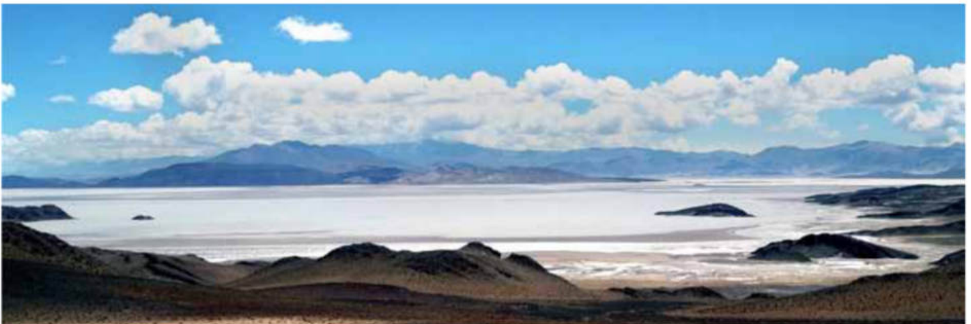
Figura 6: Salar del Hombre Muerto.