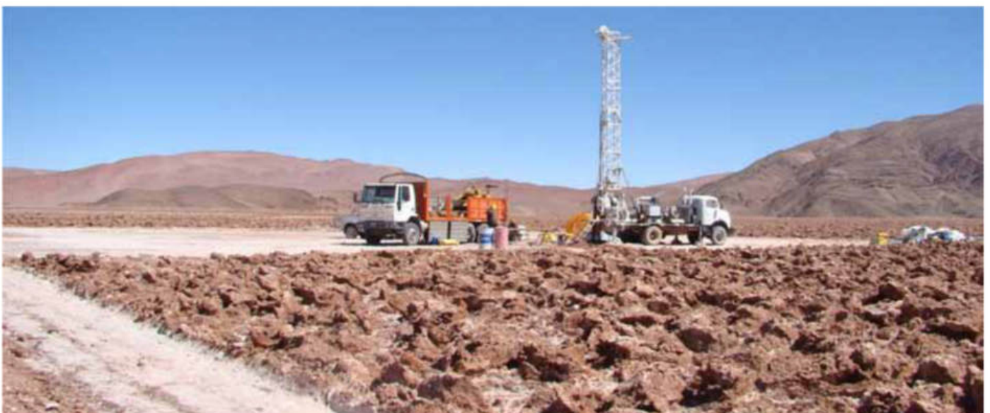
Figura 9: Perforación para exploración en el Salar de Pozuelos, Provincia de Salta