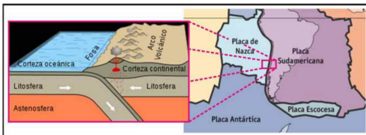
Figura 2: Formación de la cadena volcánica de los andes.

trarse a 4 km de altitud en la Puna y a 6 km de profundidad al pie de las Sierras Subandinas. Algunas decenas de millones de años después, la placa de Nazca en su contacto con la placa Sudamericana produjo fusión de las rocas, dando origen a magmas que se elevaron hasta la superficie para formar una sorprendente cadena de volcanes (Figura 2). Esa fuente de calor dio lugar a que la corteza se ablandara y comenzara a deformarse por el permanente empuje de la losa del Pacífico.